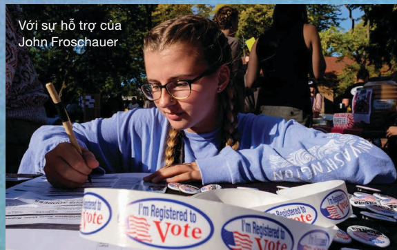
Với sự hỗ trợ của John Froschauer