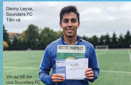
Với sự hỗ trợ của Sounders FC